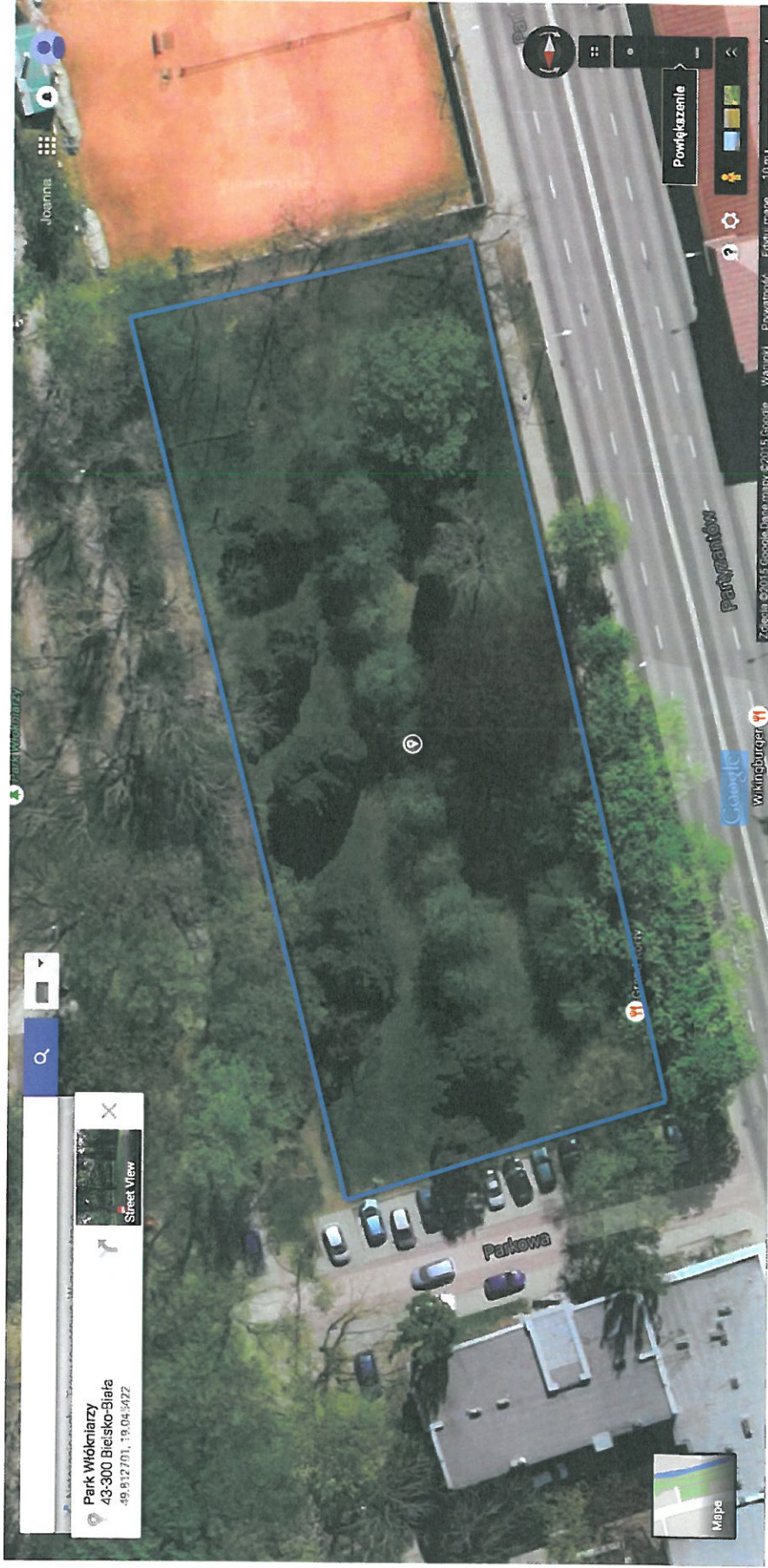
Teren na wybieg dla psów w Parku Włókniarzy - widok z lotu ptaka