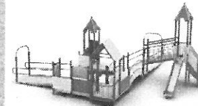
4. ZESTAW INTEGRACYJNY