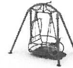
1. HUŚTAWKA DLA DZIECI NIEPEŁNOSPRAWNYCH ETAP II