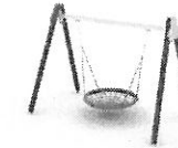
5. HUŚTAWKA Z SIEDZISKIEM TYPU BOCIANIE GNIAZDO